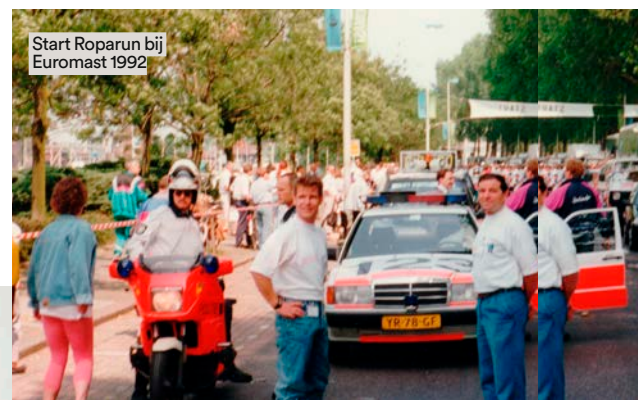
Start Roparun bij Euromast 1992