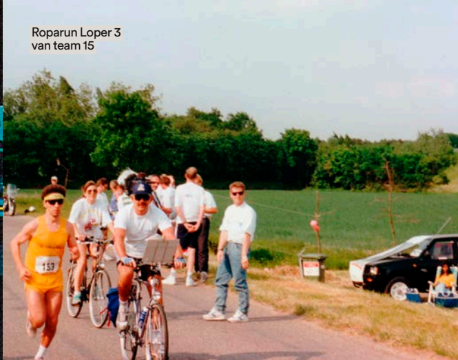
Roparun Loper 3 van team 15