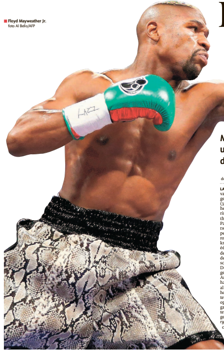
Floyd Mayweather Jr.

Mayweather Jr. en Pacquiao vechten uit wie de beste is. Ook de bokser die verliest, incasseert een record.